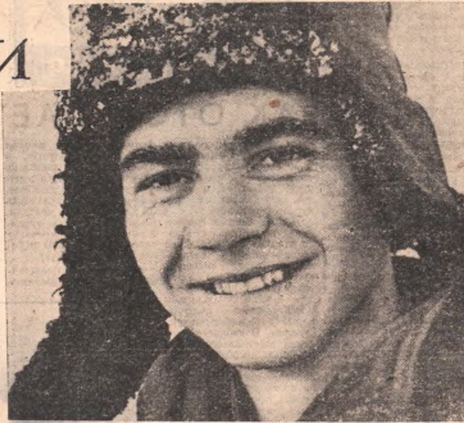
Бывает же так: с человеком едва успеешь переняться двумя словами, пошутить вместе его незатейливой шутке, и кажется — знаком с ним давным-давно. Наверное, потому, что твой новый знакомый,