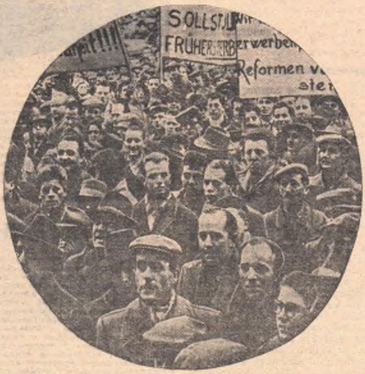
Федеративная Республика Германии. Во Франкфурте-на-Майне состоялась демонстрация протеста против намечаемой правительством реформы социального страхования по болезни. Проект реформы, предложенный министром по вопросам труда Теодором Бланком и значительно увеличивающий плату, вносимую трудящимися за лечение, вызвал волну возмущения среди западногерманского населения. НА СНИМКЕ: участники демонстрации. На одном из транспарантов требование «Не проводить «экспериментов» со здоровьем народа!»

Резко критикуя правительство за то, что оно не принимает действенных мер по борьбе с трущобами, авторы заявления подчеркивают, что в настоящее время 22 млн. американцев живут в трущобах, которые быстро растут. Если ликвидация имеющихся трущоб, говорится в заявлении, будет проходить нынешними темпами, то «потребуется по крайней мере 100 лет, чтобы их снесли, а между тем каждый год возникают новые трущобы». В заявлении признается, что «система частного предпринимательства не может обеспечить приличными жилищами семьи с низкими доходами».