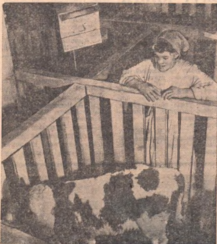
Тамбовская область. На животноводческих фермах колхоза имени Коминтерна Мичуринского района.