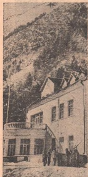
Кабардино-Балкарская АССР. В предгорьях Эльбруса, в живописном ущелье Адыл-Су, расположен альпинистский лагерь «Адыл-Су». Сюда ежегодно приезжают сотни альпинистов со всех концов страны для совершенствования своего спортивного мастерства.

КИНОТЕАТР ИМЕНИ МАЯКОВСКОГО—1-й зал — «Отверженные» (2-я серия) — в 9, 11, 4-50 и 6-50 веч. Две серии вместе — в 1 ч. дня и 8-50 веч. 2-й зал — «Школа бездельников» — в 9, 12-40, 4-40 и 8-20 веч. «Во власти золота» — в 10-50, 2-40, 6-30 и 10-10 веч. «ХУДОЖЕСТВЕННЫЙ» — «Иванна» — в 9-30, 11-20, 1-10, 3, 5, 6-50, 8-40 и 10-30 веч. «ЛУЧ» — «Золотой дом» — в 10, 3-15 и 6-40 веч. «Моряк сходит на берег» — в 11-35, 1-25, 4-50, 8-20 и 10-10 веч. ЦИРК — Заключительные гастроли музыкального аттракциона лилипуты в составе 50 артистов «Маленькие слутники». Большое представление при участии труппы акробатов на верблюдах «Кадры-Гулям» под управлением заслуж. артиста РСФСР В. И. Янушевского. Начало в 8 ч. веч.