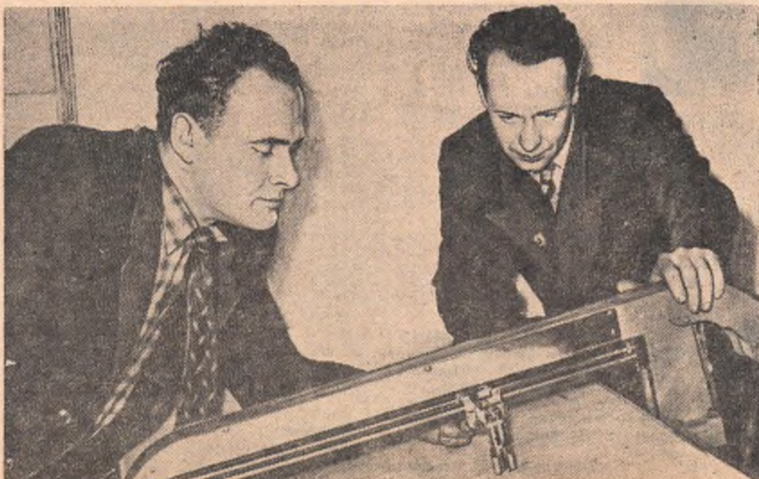
Омская железная дорога непрерывно пополняется новым оборудованием и приборами, которые служат для обеспечения безопасности движения поездов и облегчают условия труда на транспорте.

В. РАБОТНЕВА, агроном шестой фермы Черемновского совхоза.