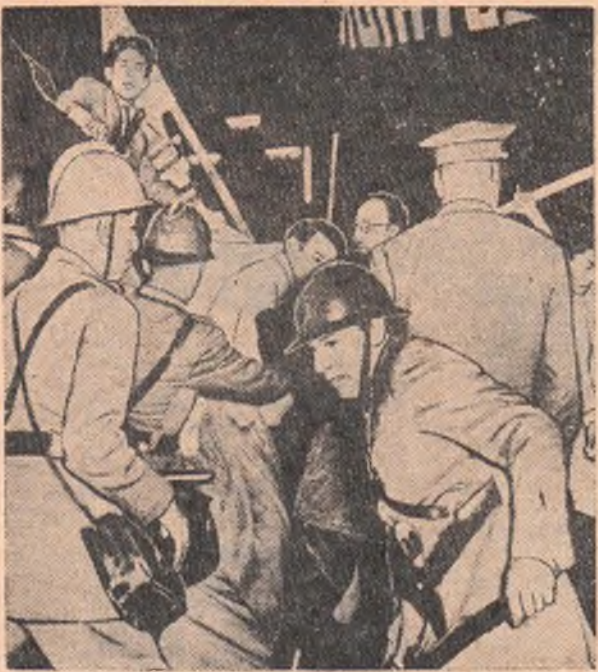
ПЕРУ. В Лиме состоялась студенческая демонстрация против принятия конгрессом нового реакционного университетского устава. В демонстрации протеста приняло участие более 2 тысяч человек. Демонстрация была разогнана полицией, которая применяла дубинки и бомбы со слезоточивым газом. На снимке: полиция разгоняет демонстрантов.