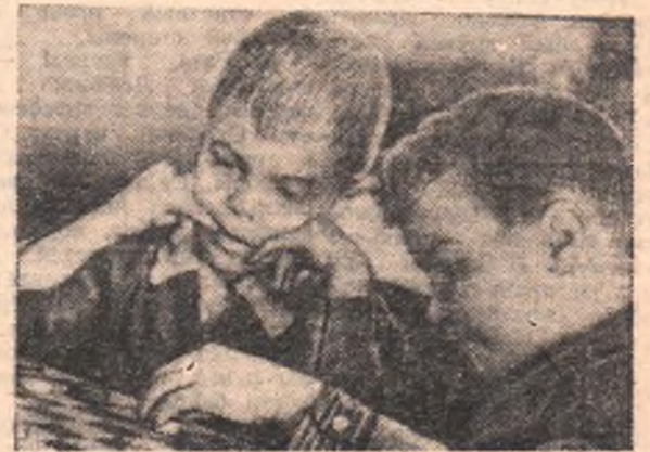
В восьмилетней школе № 10 работает группа продленного дня. Ребята с 1 по 4 класс под руководством учителя выполняют задания, а в свободное время играют в шашки, рисуют, читают книжки.