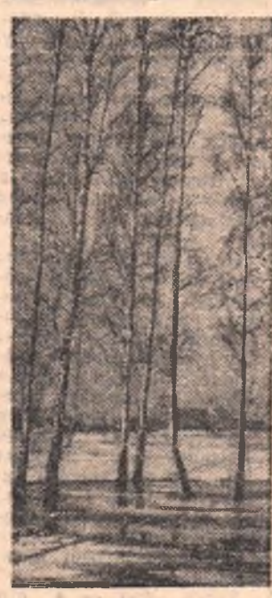
Весна пришла.