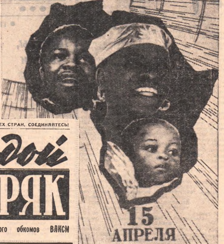
Планет художника Б. Антонова.