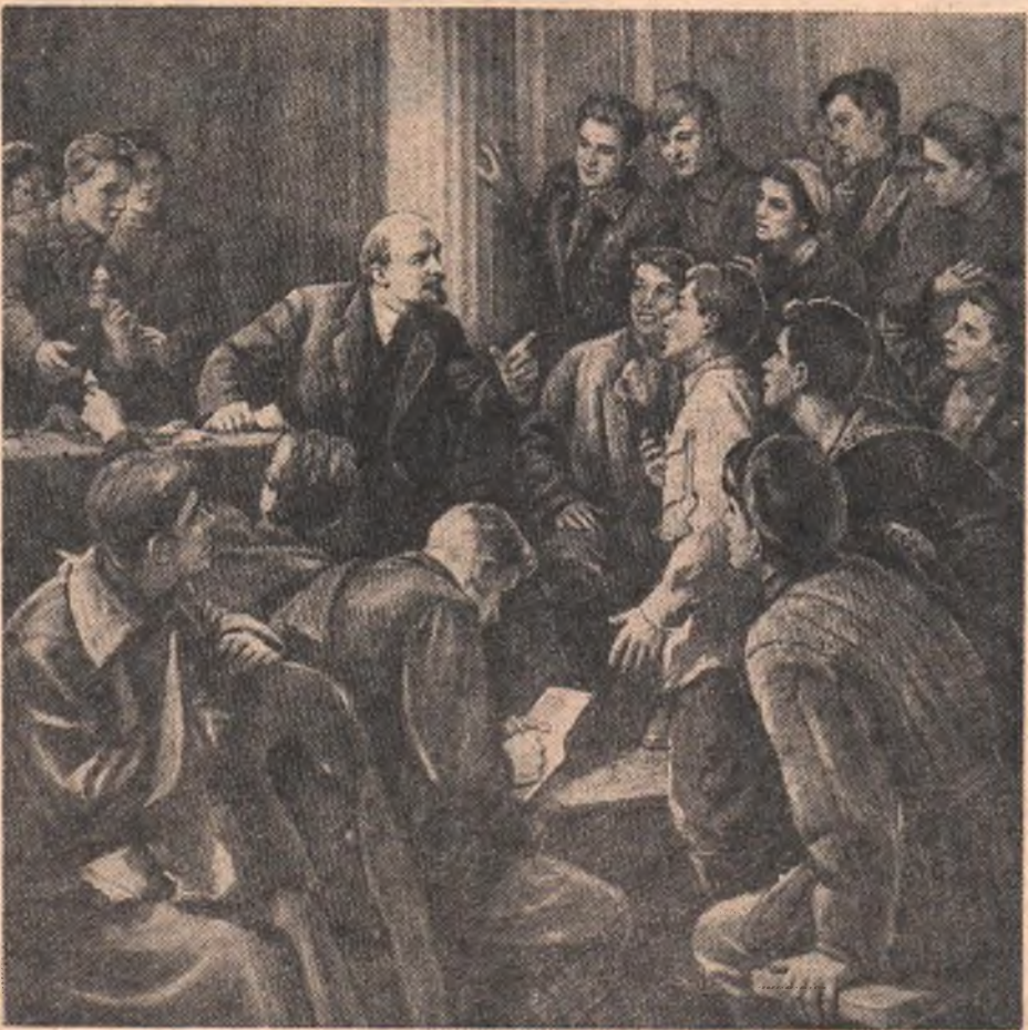
Владимир Ильич Ленин среди делегатов III съезда РКПМ.

Чичерин Георгий Васильевич (1872—1936) — видный советский дипломат. Участник революционного движения с 1904 года. С 1918 по 1930 год — народный комиссар иностранных дел; глава советской делегации на международных конференциях в Женеве и Лозанне. Был членом ВЦИК и ЦИК СССР. На XIV и XV съездах ВКП(б) избирался членом ЦК партии.