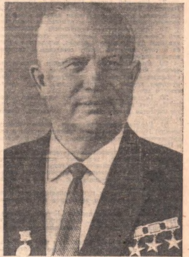
Первый секретарь ЦК КПСС, Председатель Совета Министров СССР Н. С. Хрущев.

Коммунистическая партия провела и проводит огромную работу по укреплению содружества стран социалистической системы, единства мирового коммунистического движения на принципах марксизма-ленинизма, получивших дальнейшее развитие в документах братских коммунистических и рабочих партий — Декларации 1957 года и Заявлении 1960 (Окончание на 3-й стр.).