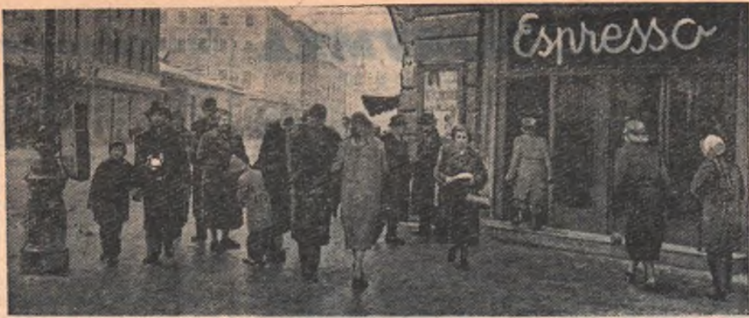
На улицах Будапешта сегодня.