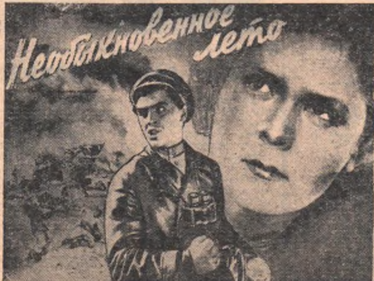
(По одноименному роману К. Федина), Автор сценария А. Наплер. Режиссер-постановщик В. Басов. Производство киностудии «Мосфильм». Выпуск 1957 г.

Омская областная контора «Кинопрокат» с 29 апреля выпускает на экраны города и области новые цветные художественные кинофильмы: