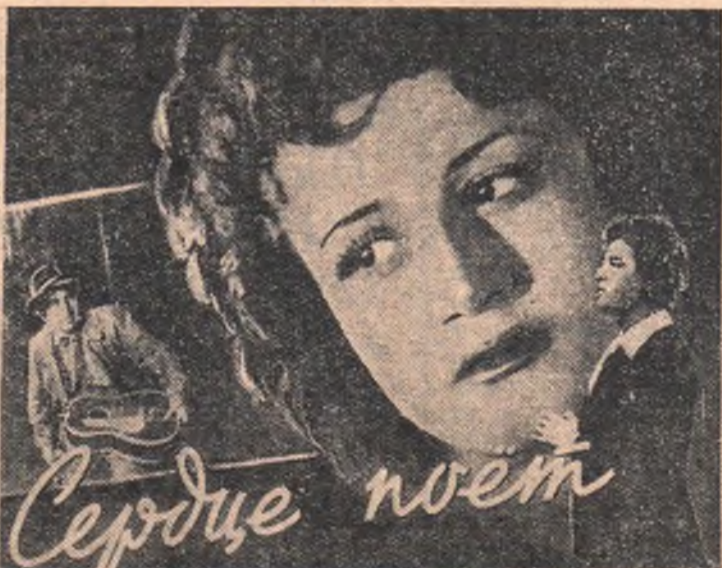
Авторы сценария М. Ерзинкян, Г. Мелик-Аванян (он же постановщик). Производство Ереванской киностудии. Выпуск 1957 г.