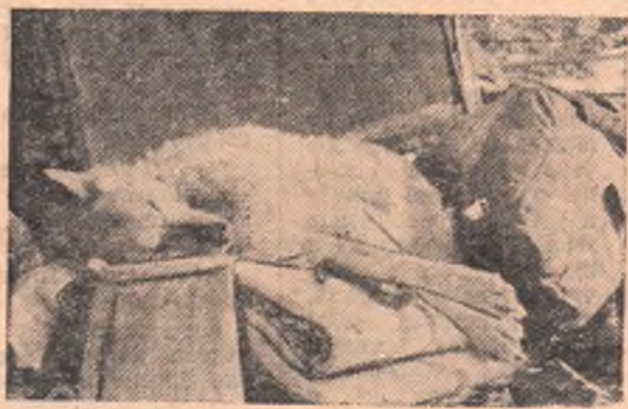
АНТАРКТИДА. Приятно подремать на солнце.