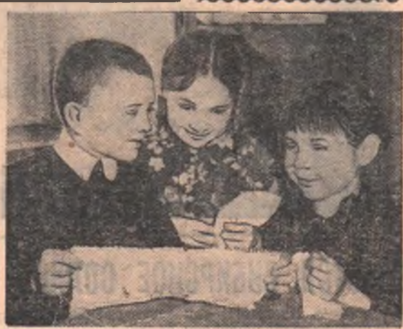
На этом снимке вы видите юных умельцев Тевризского Дома пионеров, которые с увлечением занимаются в рукодельном кружке.

В. ГОНЧАРОВ, студент, слушатель школы юнkers.