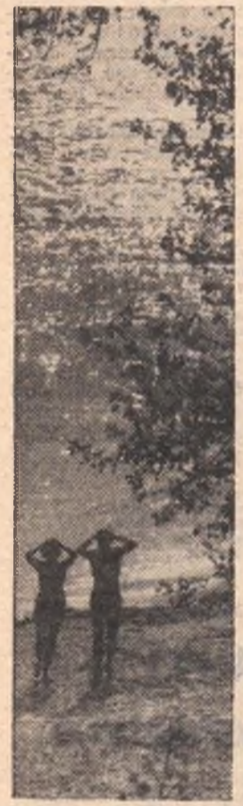
НА ИРТЫШЕ.

Дорогой друг! Подписка на нашу газету продолжается. Ты можешь получать «Молодой сибиряк» со второго полугодия. Стоимость подписки — 1 руб. 56 коп.