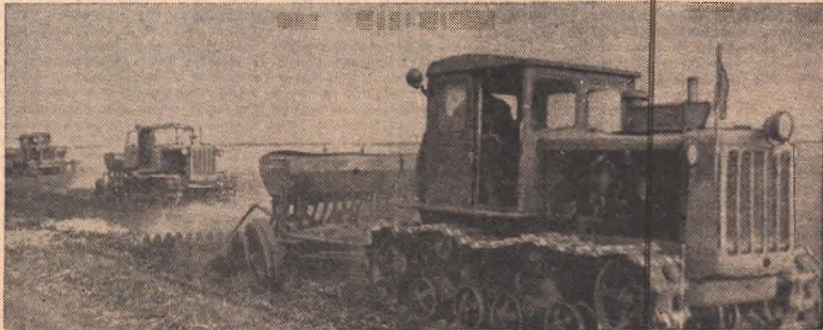
Фото и рисунок автора.