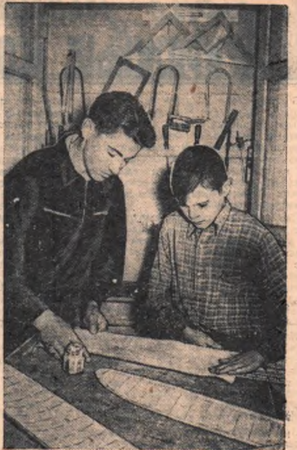
Сейчас еще трудно угадать очертания будущего планера. Не под умелыми руками юных авиамodelистов он скоро расправит легкие крылья и взлетит в синеву неба.