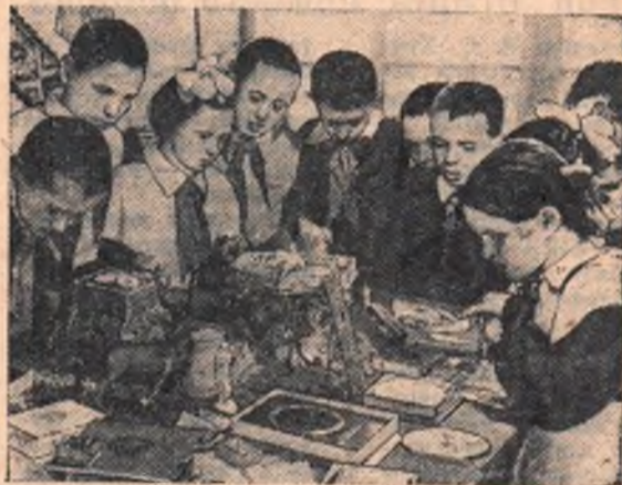
Эти подарки, с любовью изготовленные молодыми омичами, будут скоро вручены участникам VI Всемирного фестиваля молодежи и студентов. А пока фестивальные подарки находятся на выставке в городском Доме пионеров, и увидеть их может любой молодой человек. НА СНИМКЕ: учащиеся 3 «а» класса школы № 18 осматривают экспонаты выставки.

С. ТОЛОХ, студент V курса медицинского института.