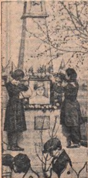
В центре районного села Седелниково стоит

красивый памятник славному партизану Артему Избышеву. До недавнего времени он был деревянным, а в прошлом году трудящиеся района перестроили его. Теперь он сделан из камня.