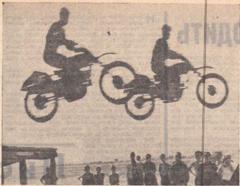
ФОТОВЫСТАВКА «МОЯ МОСКВА»