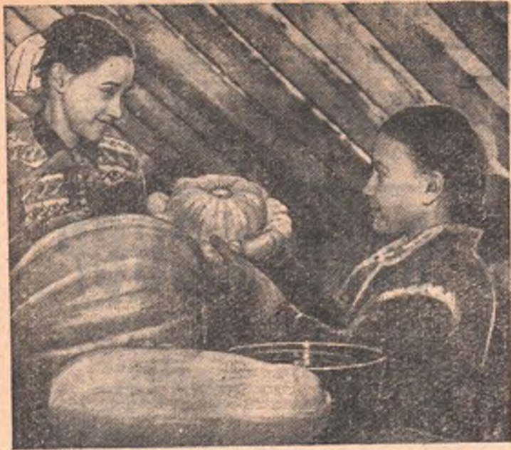
Круглый год идет работа на областной станции юннатов. Пока на улице зима, ребята тоже не теряют времени даром. Они готовят семена, следят за сохранностью семенников.

Н. РЕУКА, технорук Иртышского райкомхоза.