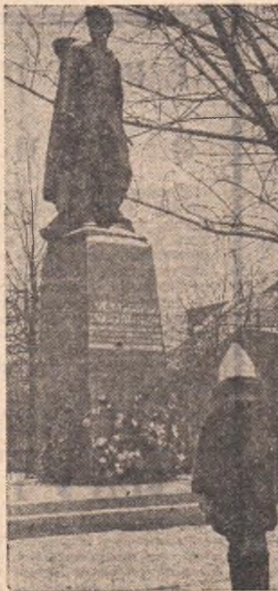
СМОЛЕНСК. Памятник Герою Советского Союза Владимиру Куриленко, комсомольцу-партизану Великой Отечественной войны (открыт 9 мая 1966 года).

Мы, старшее поколение коммунистов, крепко любим вас. И потому, что видим в вас нашу милую, но уже ушедшую боевую революционную молодость, и потому, что рядом с нами живете и создаете в настоящем, а главное — потому что