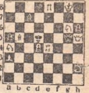
Мат в 2 хода.