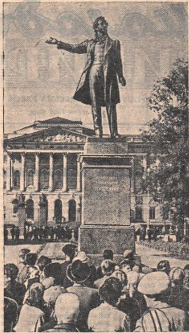
ЛЕНИНГРАД. 19 июня на площади Искусств состоялось торжественное открытие памятника основоположнику русской литературы А. С. Пушкину. Авторы монумента скульптор М. К. Аникушин и архитектор В. А. Петров.

На торжественный митинг, посвященный открытию памятника, собрались пять тысяч ленинградцев.