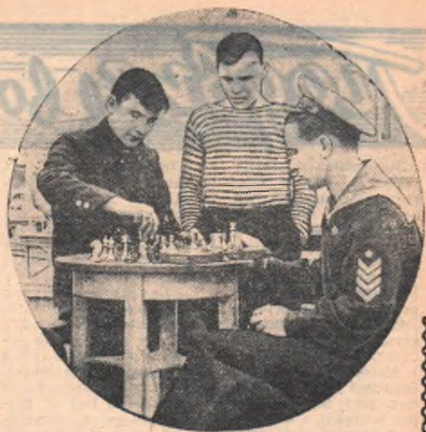
После вахты.