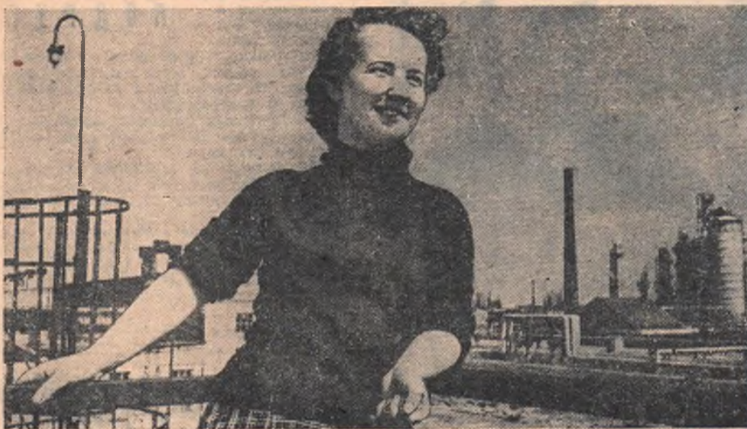
Далеко видна надпись на одной из электрообессоливающих установок нефтезавода: «Комсомольская установка имени Всесоюзного фестиваля молодежи». Юноши и девушки этой установки первыми на заводе объявили поход за чистоту и культуру на производстве. Молодые нефтяники, следуя примеру грозненцев, сэкономили для Родины не одну тонну нефти.