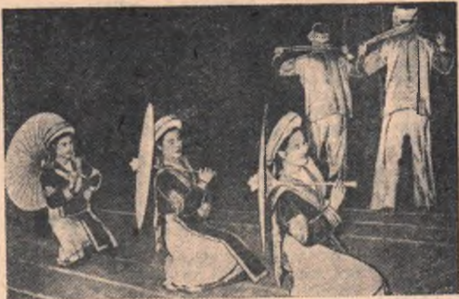
Молодежь Демократической Республики Вьетнам активно готовится к VI Всемирному фестивалю молодежи и студентов. Недавно в Муниципальном театре Ханоя состоялся отбор певцов и танцоров, которые поедут на фестиваль. В смотре приняли участие многие художественные коллективы из разных районов страны. НА СНИМКЕ: представители национальности мяо исполняют танец с зонтиками.