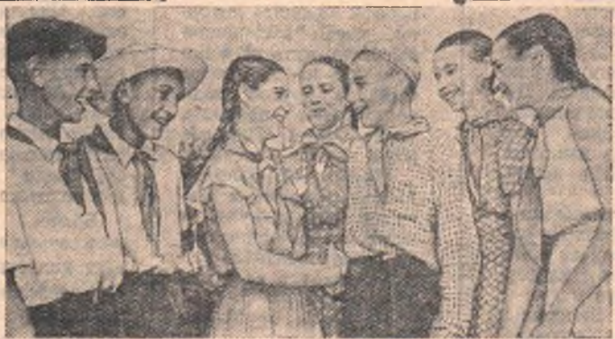
На днях отдыхать в пионерскую здравницу «Артек» выехала большая группа школьников города Омска и области.

По календарю розыгрыша первенства Омска по футболу состоялись еще три состязания. Команда «Авангард» выиграла у клуба «Металлист» (4:0), футболисты «Энергии» одержали победу над клубом «Машиностроитель» (1:0), спортсмены Дома офицеров нанесли поражение спартаковцам (5:0).