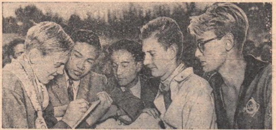
Москва. VI Всемирный фестиваль молодежи и студентов. В Зеленом театре Всесоюзной сельскохозяйственной выставки состоялся концерт молодежи Швеции. НА СНИМКЕ: перед началом концерта. Шведские студенты обмениваются адресами со своими вьетнамскими друзьями.