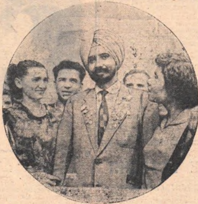
При осмотре Московского Кремля туристы-омичи познакомились с участником VI Всемирного фестиваля молодежи и студентов из далекой Индии.