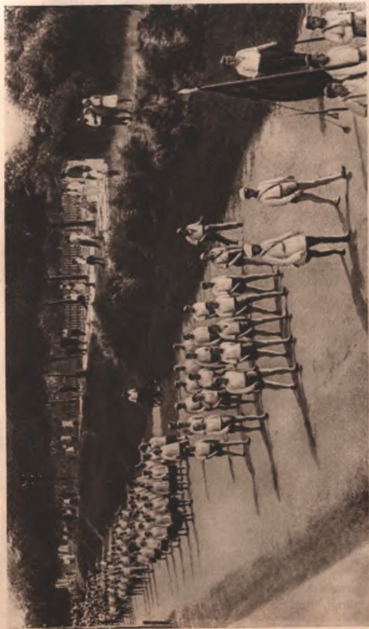
Коммуна им. Ф. Э. Дзержинского. Строй коммунаров в летнем походе в Сочи (1931 г.)