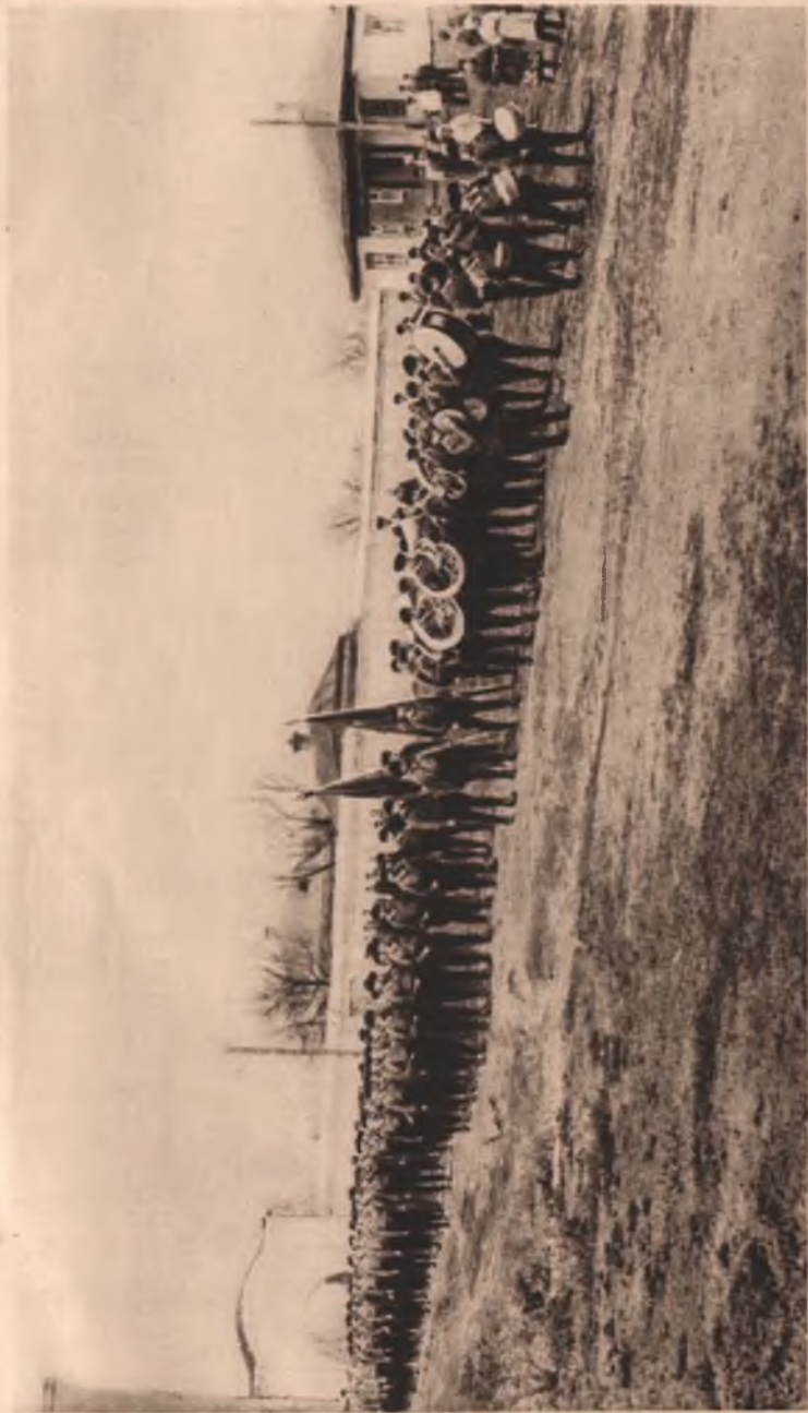
Кураж-колония им. М. Горького. Строй колонистов с оркестром при выходе из колонии на прогулку