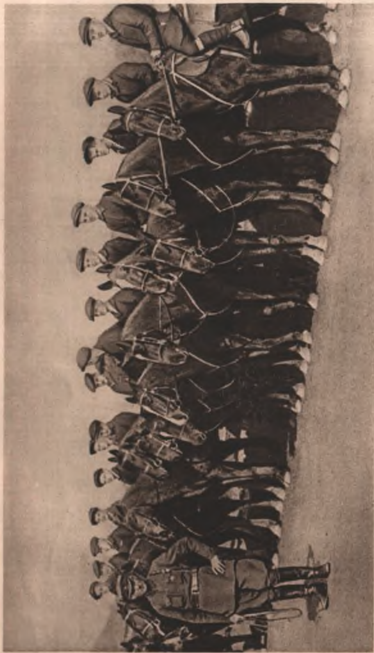
Кавалерийская секция в коммуне им. Дзержинского