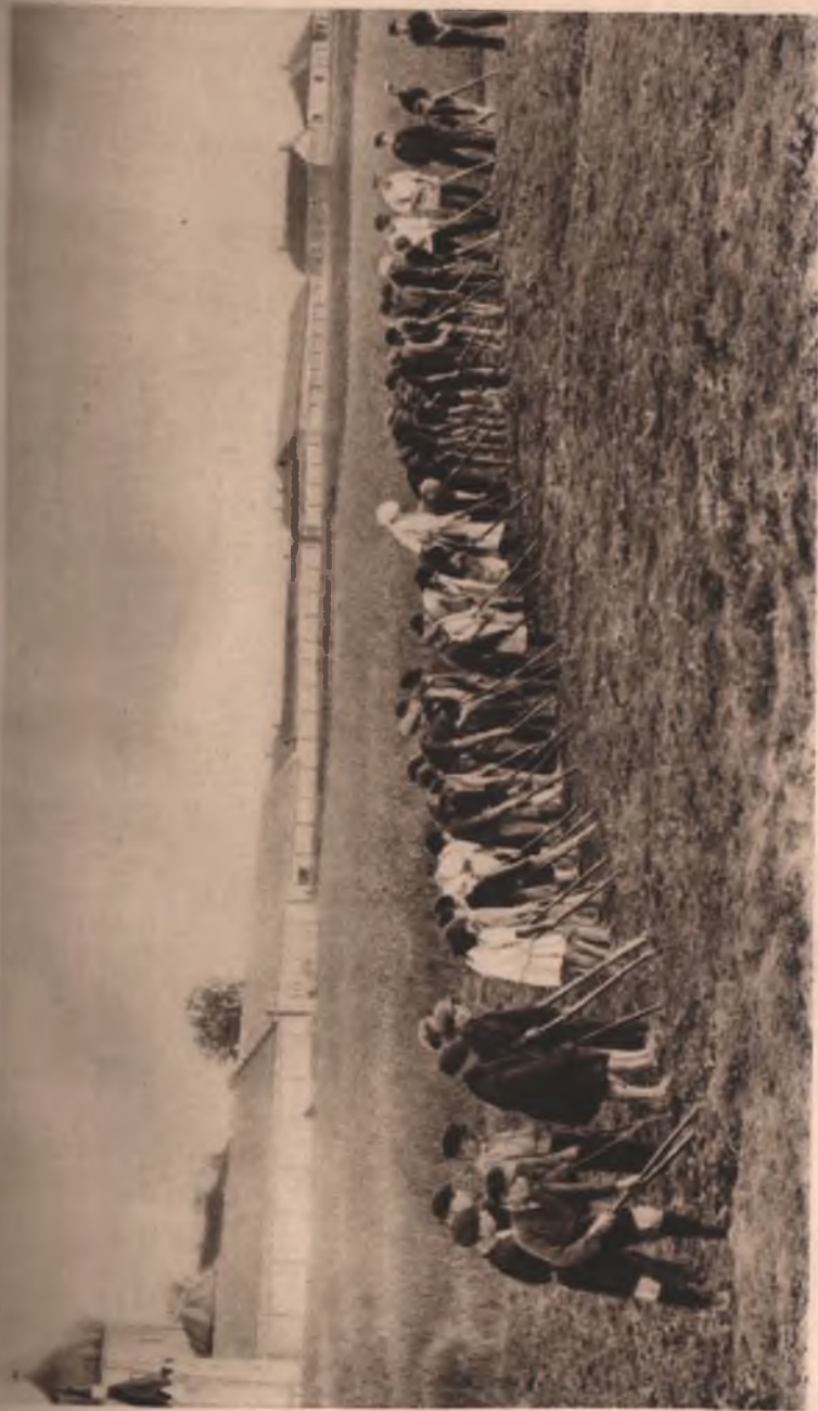
Сельскохозяйственные работы воспитанников колонии им. Горького (Курыж). Окучивание