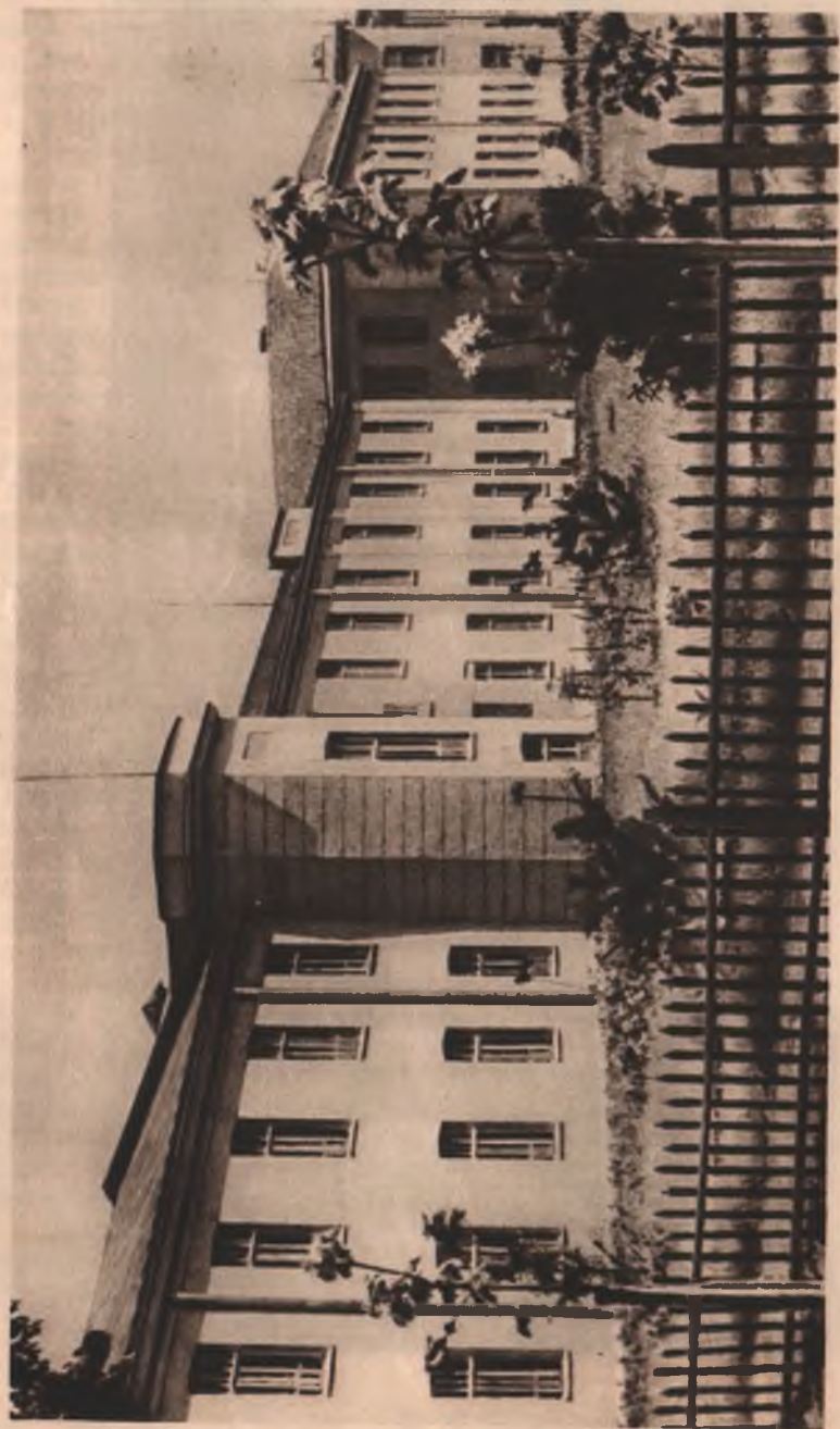
Здание коммуны им. Дзержинского в 1931 г.