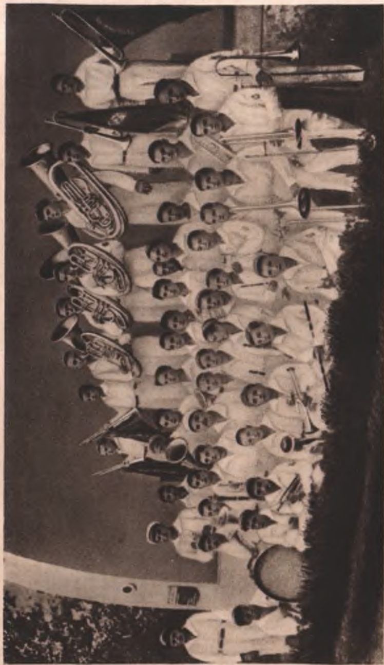
Оркестр коммуны им. Дзержинского