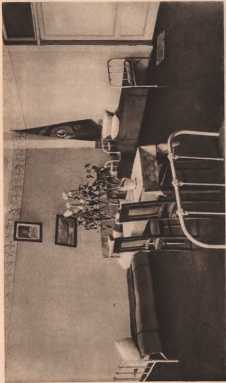
Спальня в коммуне им. Дзержинского