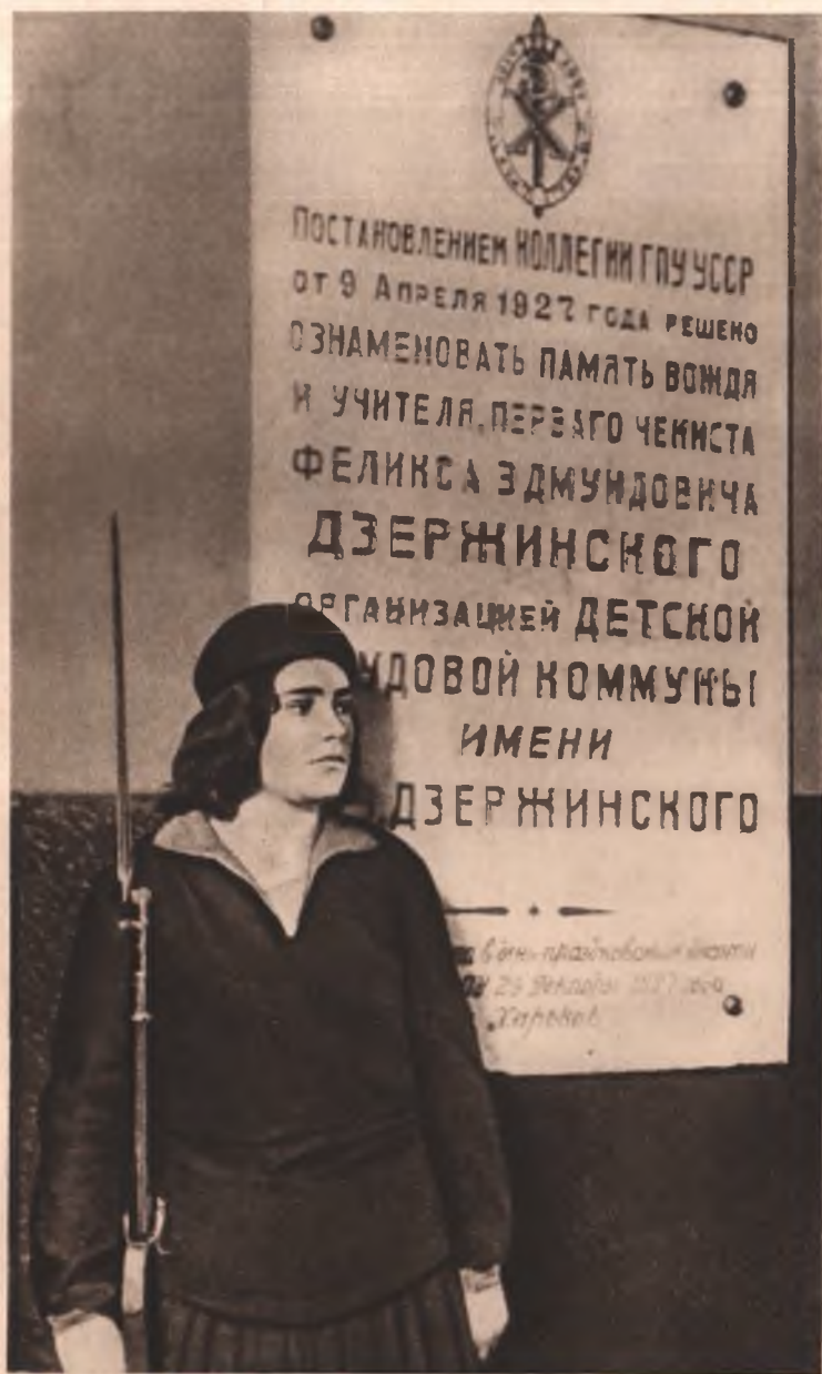
Дневальный у мемориальной доски у входа в коммуну им. Дзержинского