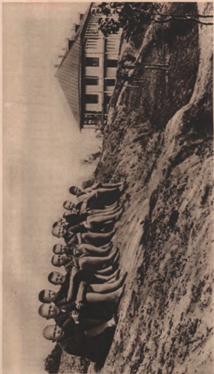
Группа куряжан в 1927 г. Справа школьное здание