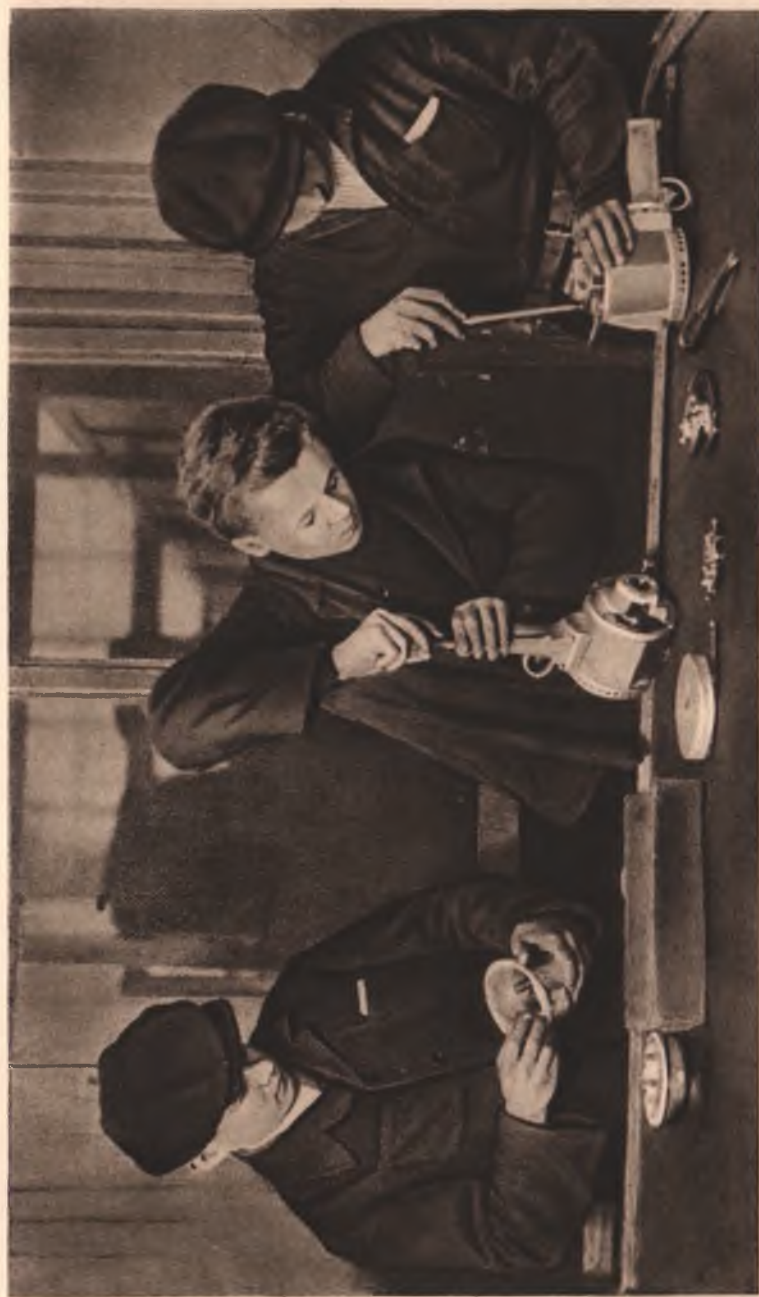
Сборка электросверлилки «ФД-1»