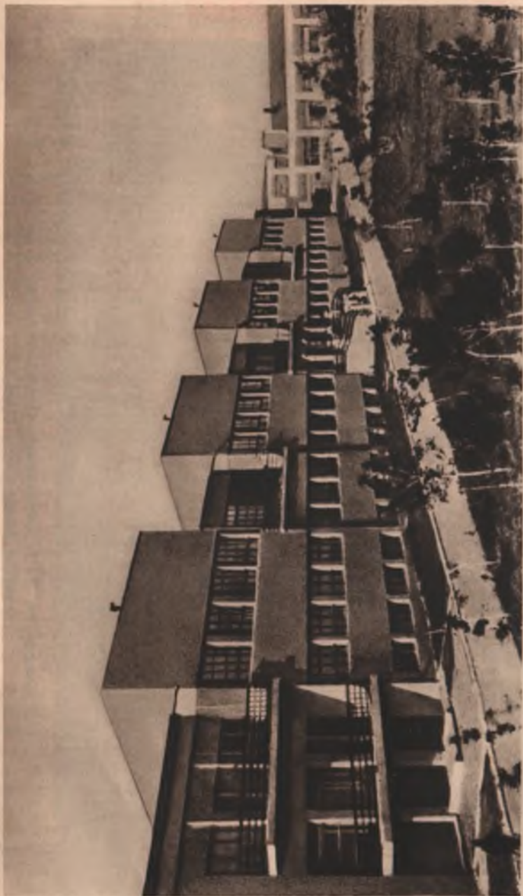
Внешний вид завода фотоаппаратов в коммуне им. Дзержинского