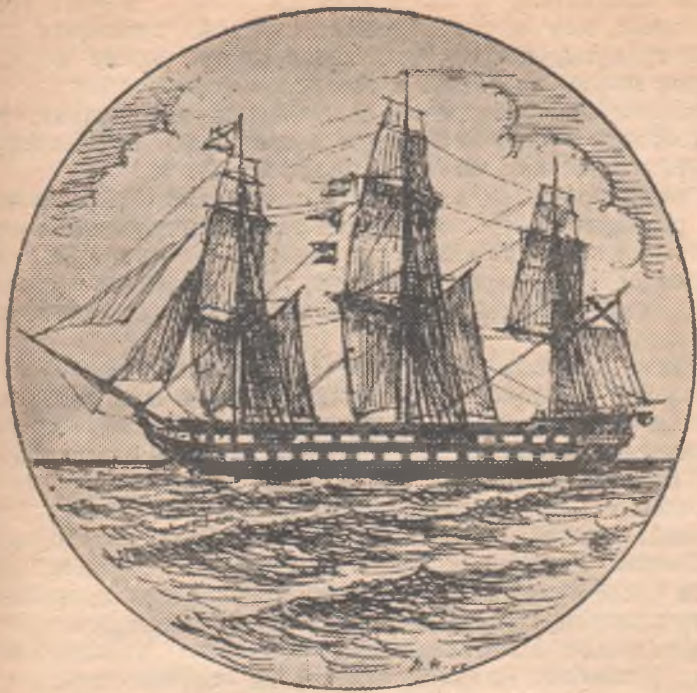
Линейный корабль «Императрица Мария», на котором держал свой флаг адмирал Нахимов в Синопском бою.

неприятеля и взаимная помощь друг другу — есть лучшая тактика».